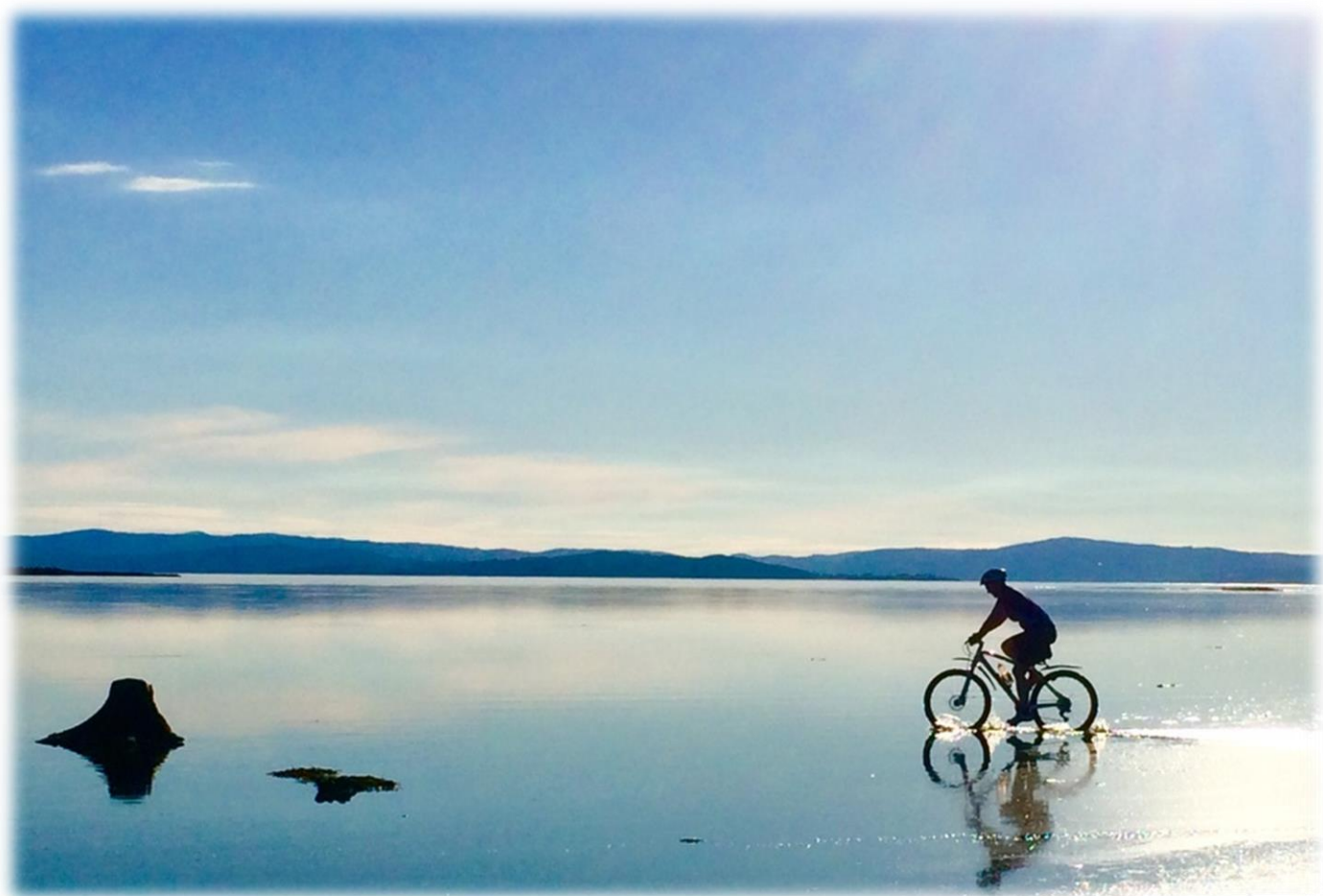
Ørin nord, Verdal

Administrasjonssjefens forslag 6. november 2015