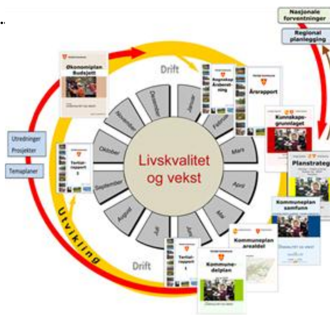
Figur 1 Plan- og styringssystemet